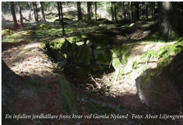
En infallen jordkällare finns kvar vid Gamla Nyland

De kom att bo och leva återstoden av sina liv på det lilla torpet Nyland. Detta var ovanligt i en tid då torparfamiljerna, ofta flyttade omkring i ett ständigt sökande på något bättre. Det är idag svårt att förstå vad det var som gjorde att de började nyodla mark just här. Jorden är mager stenbunden och svårarbetad. Men det fanns kanske inte så mycket att välja på. De hade då två barn varav det sista, Johan, var född, på